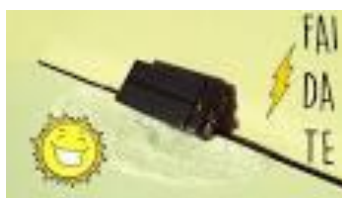
caricabatterie ad energia solare